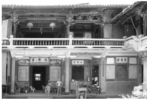
图4 丰富而又强烈的色彩

的色彩相呼应。诸如红配绿、红配紫等乱搭配色,从色彩应用上就印证了“俗”文化的审美特质(见图4)。