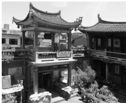
图1 余氏六合祖居门楼亭与连廊

莆仙地区地处闽东南沿海,位于福厦黄金海岸线中部,海岸线较长且曲折。北依福州,南接泉州与厦门,东临大海,沿海有湄洲湾、兴化湾和平海湾三大海湾渔港,地处兴化平原,地势平坦,有荔城区、城厢区、涵江区、秀屿区和仙游县,一条木兰溪贯穿仙游至莆田注入兴化湾。地理概括为“四区一县兴化府 ① ,三湾渔港木兰溪”。整个地势西北高,东南低,西北有高山戴云山脉延伸,北有望江山,东南是兴化平原。莆仙地域的民居建筑因地制宜,坐西北朝东南面,大致与海岸线平行,在夏季有利于海风穿堂而入,穿堂风能够有效地调节中庭与主厅的潮湿闷热。当地的居民通常在晚饭后,与亲朋邻里聚集于此纳凉,闲话家常。莆田涵江区顶坡村鸟门1号和江口镇港下村余氏六合祖居这两栋20世纪30年代建造的华侨住宅的入口大门上均有眺望和纳凉的门楼亭,四边回廊与厢房连通,整体建筑前方通透,后面围合,正是契合这样的地理气候特征(见图1)。