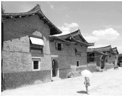
图3 红砖与青石砌墙组成梅花状图案

在莆仙地域传统的文化影响很深,只是在近代以来,外来的建筑文化在华侨移民的进程中,逐步渗入。直接表现在营建选材与匠造技艺的精良化,凸显了华侨优越的经济实力与外化审美的心