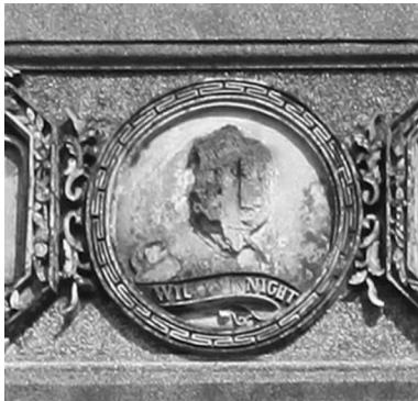
图 6 英文单词装饰的灰塑图案

灰塑浮雕装饰在莆仙地区侨乡民居建筑中别具特色，它能够反映出该地区人们的生活和审美的状态。在灰塑装饰纹样局部制作上使用镜面玻璃镶嵌，极具独特性。它是闽东南侨乡建筑装饰审美趣味的代表性体现，镜面玻璃镶嵌在灰塑浮雕的装饰纹样上，呈现粼光闪耀，契合莆仙地域人民的“俗”文化审美趣味。侨居建筑中的灰塑亦多夹杂海外洋化装饰图案，类似巴洛克时代西方贵族的家族徽章装饰图案，有的还出现用英文单词装饰的灰塑图案，最能体现中外兼容并蓄的文化特征（见图 6）。