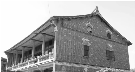
图 5 “方巾脊”，俗称“贡银头”

莆仙地域侨乡民居建筑除了马鞍形屋脊以外，最具有特色的当属马鞍脊两头翘起平直收口的脊头。从侧立面看极似明代儒生所戴的方巾 ① ，因此将屋脊两端起翘收口的脊头称为“方巾脊”，俗称“贡银头” ② 。这样的脊头在莆仙地区的民俗认为，没有对邻里的屋子产生尖锐的“伤害”，谓之“文脊” [4] （见图 5）。从文化地域特征解读，则突显出莆仙地域人民比较传统内敛厚德的地域人文特征。通过实地调研发现，莆仙地域也有像福建闽南地区的尖尖翘起的燕尾脊，但是该地域多数用于寺庙和官府建筑上，传统民居建筑和近代侨居建筑几乎不见，基本都是“方巾脊”的脊头装饰。从一个侧面也体现了官方权利和寺庙信仰在该地区有着绝对强势，人民温逊，侨民也是敦厚内敛的性格。